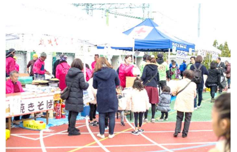
〔やきそば・フランクフルト〕