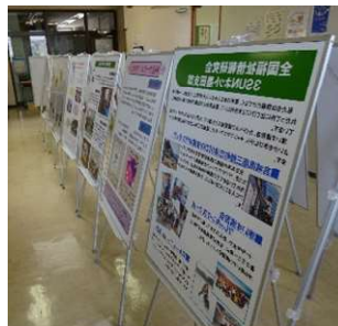
[ボランティア団体紹介]