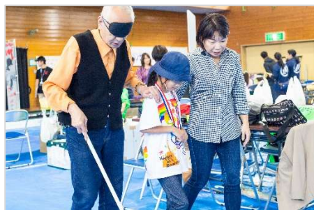
〔昨年の様子 ガイドヘルプ体験〕