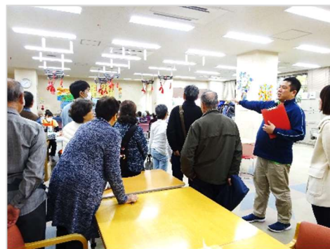
〔施設見学の様子 (前回開催時)〕