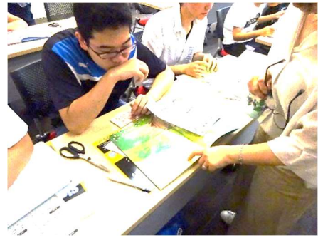
〔絵本に点字をつけてみよう〕

今年は参加者の4割が複数の施設とうで活動していました。また、小学生だけでなく、中学生や高校生の親子参加もありました。