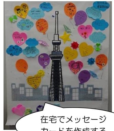
在宅でメッセージカードを作成する

今年もすみだボランティアセンターでは、夏休み期間を中心に「2022夏体験ボランティア」を実施します。 新型コロナウイルス感染症拡大防止対策を万全にして、自宅でできる活動やオンラインで行うメニューを企画しています。 たくさんの皆さまのご参加をお待ちしています！