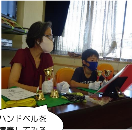
ハンドベルを演奏してみる