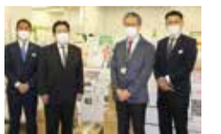
東京東信用金庫本店様