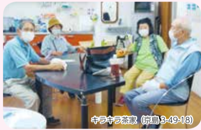
キラキラ茶家(京島3-49-18)

相談業務のほか、誰もが気軽に集い、交流できる居場所の設置や、住民に向けた講座やイベントの開催などを実施することにより、地域活動の充実を図ります。