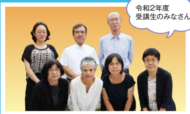
令和2年度 受講生のみなさん

市民後見人とは、親族や弁護士などの専門家ではなく、一定の研修を修了した区民の方による成年後見人のことです。判断能力が十分でない高齢者や障害のある方に寄り添って、成年後見人が金銭管理や福祉サービスの契約などを行い、生活を支えます。