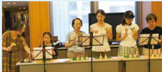
2019年のハンドベルの様子