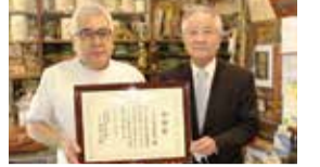
すみだ業協同組合様