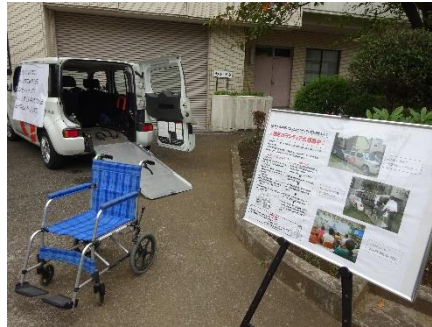
〈ハンディキャブ展示〉

新型コロナウイルス感染症拡大防止のため、昨年度同様、規模を縮小し、事前申込みの30分入替制としました。来場者の方々には検温、手指の消毒にご協力いただき、会場内も換気と消毒を随時行いました。