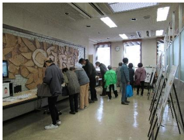
〈ボランティア団体活動紹介〉