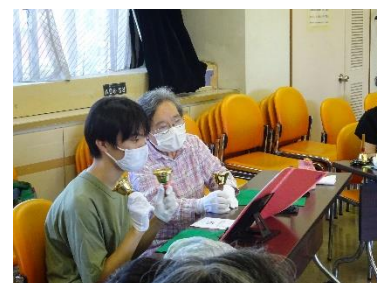
〈夏! 体験ボランティア〉