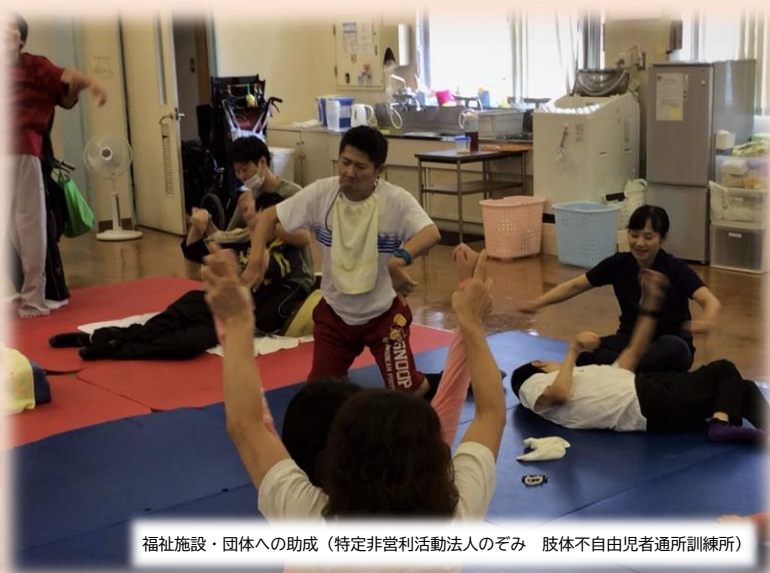
福祉施設・団体への助成（特定非営利活動法人のぞみ 肢体不自由児者通所訓練所）