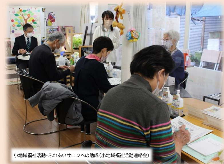
小地域福祉活動・ふれあいサロンへの助成（小地域福祉活動連絡会）