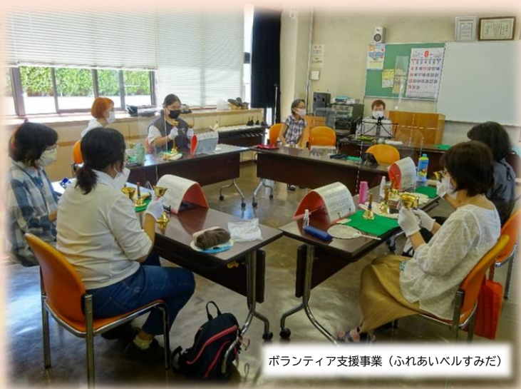
ボランティア支援事業（ふれあいベルすみだ）