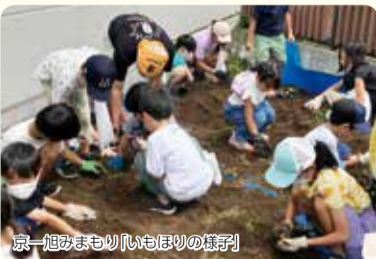
京一旭あまもり「いもほり」の様子