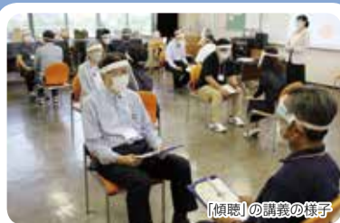
「傾聴」の講義の様子

今後は、権利擁護センター職員の皆様の指導のもと、「自助・互助・共助・公助」を礎として、スキルアップに努めます。そして、心に寄り添いながら、声なき声の方々の支援・貢献に尽力していきたいと存じます。