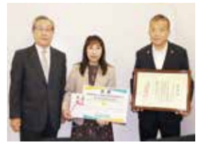
明治安田生命保険相互会社 江東支社様