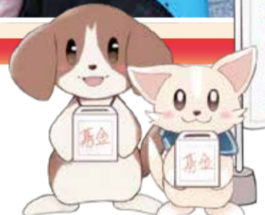
H・Mさん画 (このイラストは区内在住の方に協力いただきました。)

本運動への募金は、個人の方は金額により所得税、住民税の控除対象となり、法人の場合は法人税の算出にあたり寄附額を全額損金とすることができます。くわしくは当協議会へお問合せください。