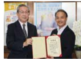
公益社団法人 本所法人会様