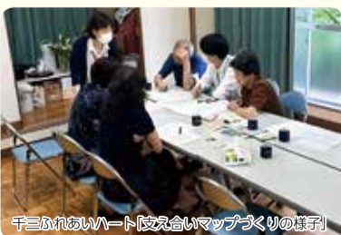
千三ふれあいハート「支え合いマップづくり」の様子