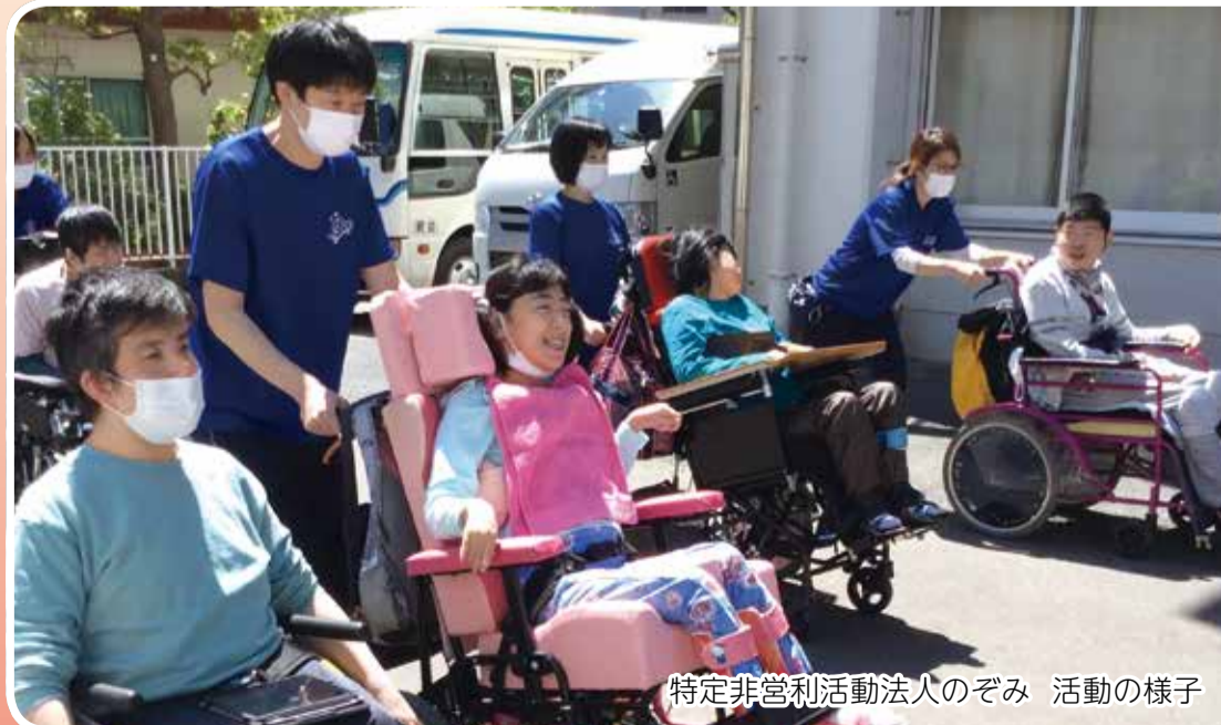
特定非営利活動法人のぞみ 活動の様子