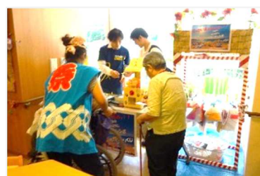
〔高齢者施設で縁日の手伝い〕

[申込み] 「2019夏！体験ボランティア」に参加するには、『事前説明会』への参加が必要です。 いずれかの説明会に必ずご参加ください。 ⇒ 説明会日程表は6面です。