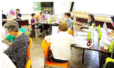
〔前回 交流会の様子〕