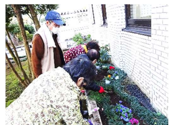
〔賞品のお花を植えました〕