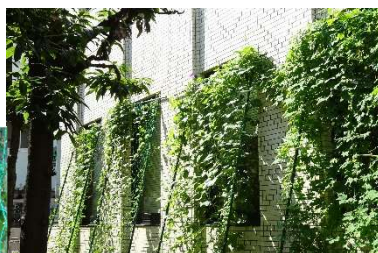
〔伝説のカーテン賞〕受賞〕