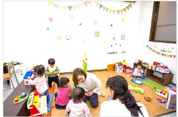
〔 たくさんのおもちゃがあるよ 〕

そして、社会福祉協議会の職員が常駐しているので、民生委員や児童委員のかたがたなど地域の福祉活動者とも連携しワンストップで困りごと相談に対応できます。また、毎週水曜の午後 1 時から 3 時までにはボランティアさんによるハンドマッサージが受けられ、毎月第二金曜午後 1 時半からは折り紙を教えてもらえます。また、毎月第四水曜午後 1 時半から 3 時半までは街かどカフェが開かれ、