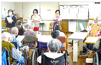
〔みんなで歌いましょう〕