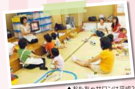
▲おもちゃサロンは平成21年3月に曳舟集会所で開始しました。

その間、多くのお子さんや保護者の方に楽しんで遊んでいただき、また、多くのボランティアの皆さんにご協力をいただきました。10周年をお祝いして、いつものボランティアセンターを飛び出してイベントを開催します。皆さん、遊びに来てください。