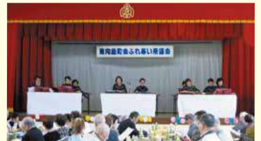
ふれあい茶話会(第二寺島小学校にて)

秋には、地域で暮らす80歳以上の高齢者との交流を目的とした「ふれあい茶話会」を開催しています。11月に開催された茶話会には委員・高齢者合わせて100名近くの方が出席され、大正琴の演奏に合わせてなつかしの歌を歌うなど、楽しいひとときを過ごされました。