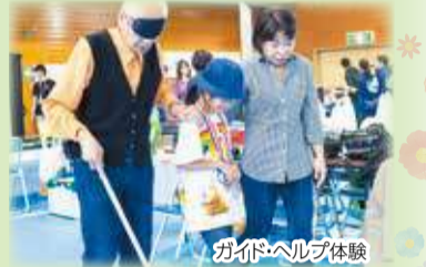
ガイドヘルプ体験

会場の隅田小学校の5年生や近隣町会、PTAの方々をはじめ、ボランティアセンターがある地元の町会等多くのボランティアの方々にご協力をいただきました。また、企業や団体からも後援や協賛、物品の提供などをしていただきました。ありがとうございました。