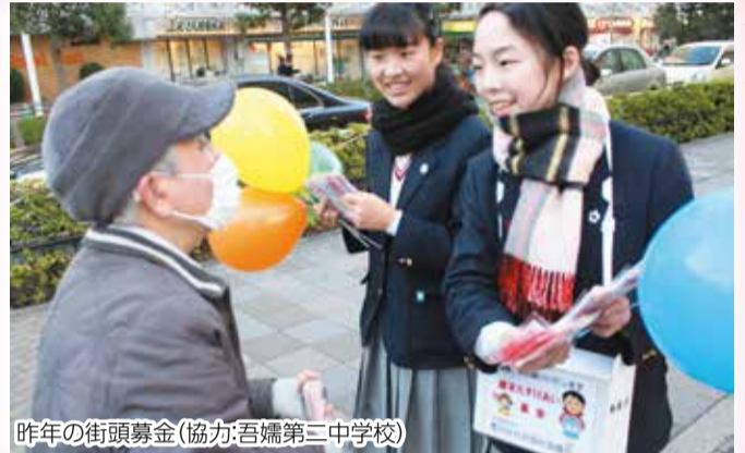
昨年の街頭募金(協力:吾嬬第三中学校)