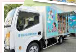
◀平成24年からおもちゃトラックを運行しています。