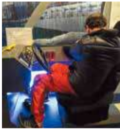
昨年の様子 「水没した車から脱出できますか?」