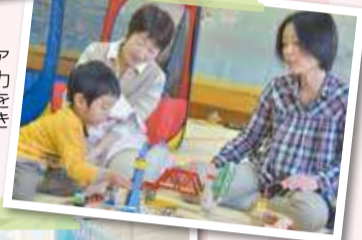
▶ボランティアの皆さんの協力により、活動を続ける事ができています。