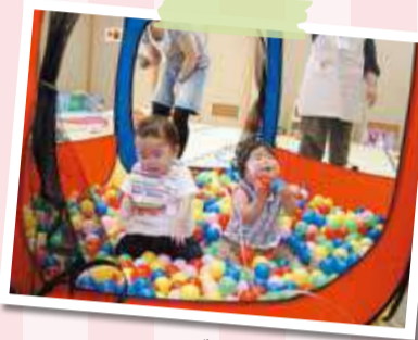
▲開始当初からあるボールピット。