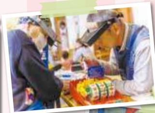
◀おもちゃドクターにより、これまで多くのおもちゃが治りました。

*イベント当日はすみだおもちゃサロンはお休みとなります。あらかじめご了承ください。