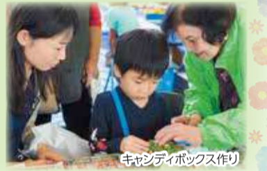
キャンディボックス作り