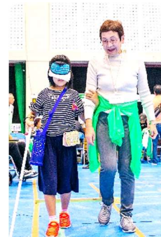
〔ガイドヘルプ体験〕

PTAの皆様、ボランティアセンターがある地域の町会等多くのボランティアのかたがたにご協力をいただき、無事に開催できました。また、区内の企業や団体からも後援や協賛、物品の提供などをいただきました。ありがとうございました。