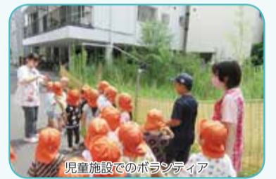
児童施設でのボランティア

【参加者説明会 申 込 み】6月3日(月)午前9時からホームページの申込フォームまたは平日の午前9時～午後5時半までに☎3612-2940までお申込みください。